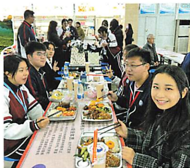
学校食堂にて昼食