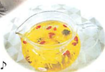
休憩では菊茶でティーブレイク♪