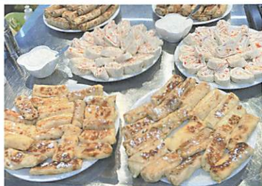
クリームチーズロール& コテージチーズ入りクレープ