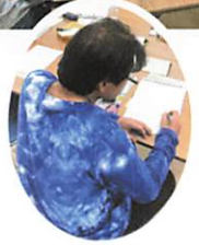
40秒のスピーチは 簡素に印象深く

“全国通訳案内士”とは、国土交通省認定の国家資格で、報酬を受けて外国人に付き添い外国語を用いて旅行に関する案内をする通訳のスペシャリストです。