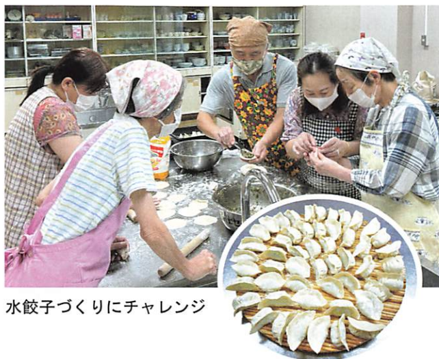
水餃子づくりにチャレンジ

本市でも外国の方が多く居住しています。多文化理解は、共生社会の実現に向け、ますます重要度が高まっています。本講座は今年度からの初めての試みでしたが、1つの国をキーワードとして様々な視点から学ぶことができました。今後も公民館では、国際理解の講座を企画したいとのことでした。