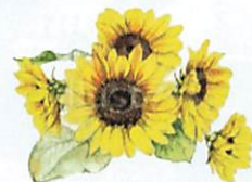
「ひまわり」はウクライナをイメージするお花です