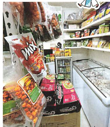
所狭しとベトナム(アジア)食品が♪