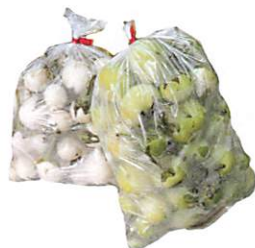
珍しい白茄子や川魚や肉なども!