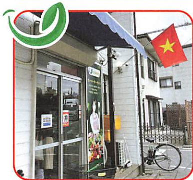
店の玄関のベトナム国旗が目印