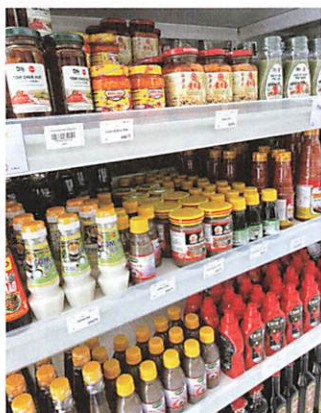
珍しい調味料がいっぱい!